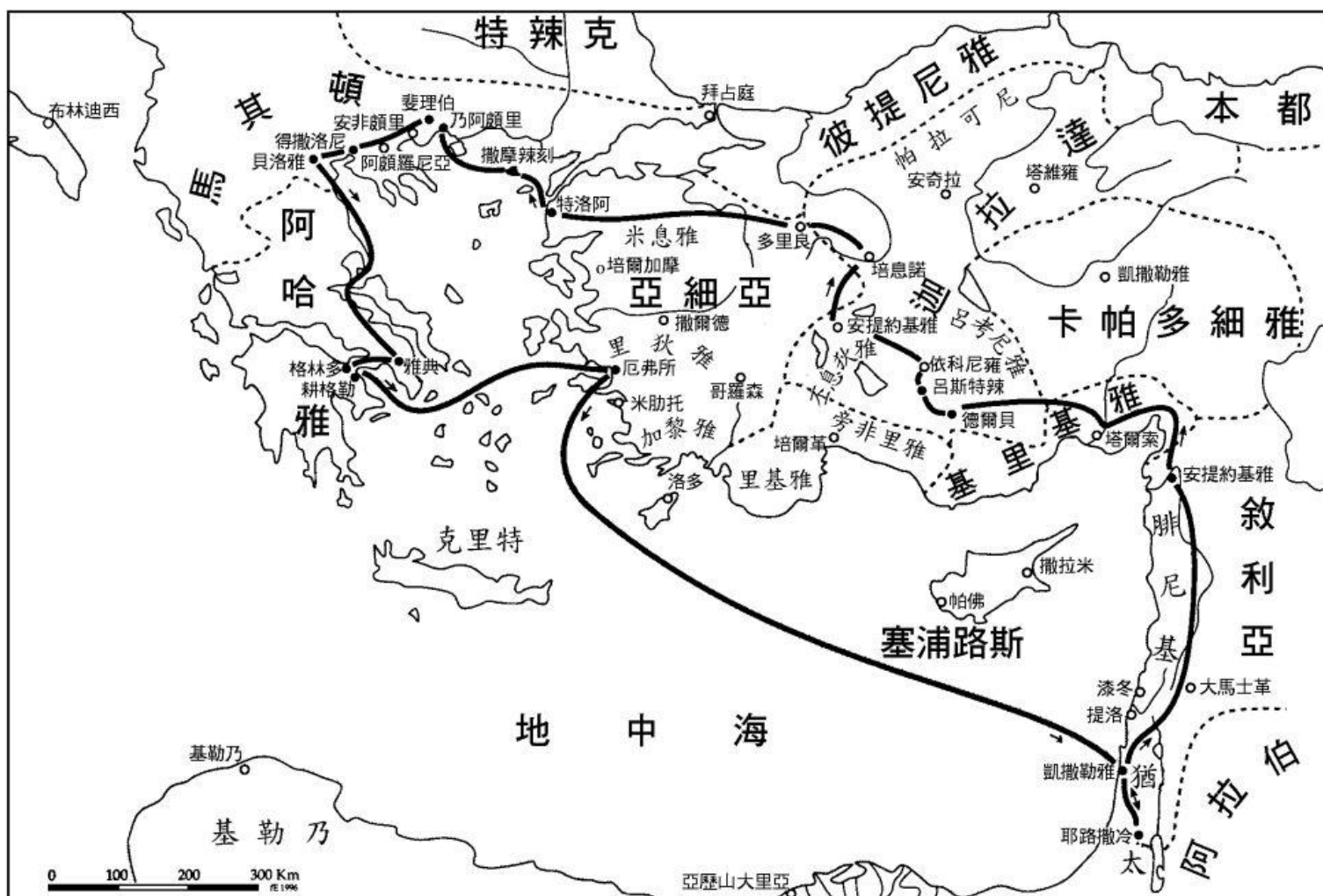
聖保祿第二次傳教旅程 (公元50-53年)