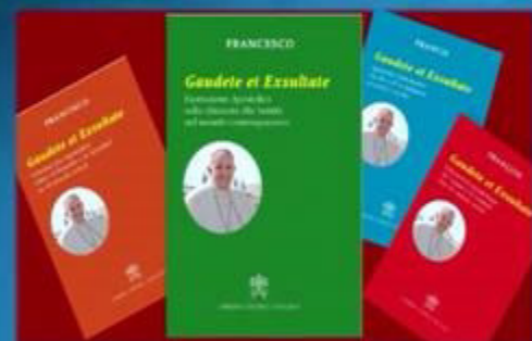
教宗方濟各頒佈《你們歡喜踴躍吧！》宗座勸諭

■ 教宗方濟各於4月9日頒佈宗座勸諭《你們歡喜踴躍吧！》，邀請信眾在當代世界回應成聖的普遍召叫。這道勸諭總共分成5章、177個段落號碼，指明真福八端是成聖的康莊大道，因為它與世俗背道而馳。許多「鄰家」的聖人展現出人人皆能成聖，聖德的生活與慈悲的生活息息相關。慈悲乃是「天國的鑰匙」，因此聖人會受到感動，採取行動協助不幸的人。