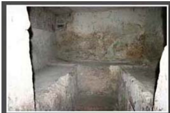
墓室的石床及骨庫