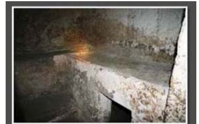
Benches & Repository Pit