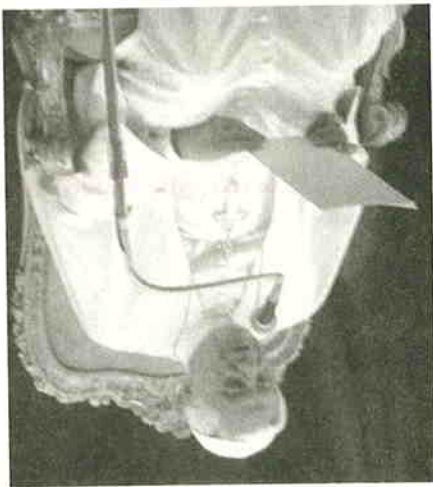
教宗本篤十六世於9月16日特別接見國際聖經大會全體與會者，並發表勉勵之言，內容摘錄如下：

教會的生活中「大會的全體參與者致以親切問候。是次聖經大會由天主教世界聖經協會與宗座促進基督徒合一委員會聯合主辦，目的是紀念《天主的啟示教義憲章》頒布四十周年。我恭賀你們發起這個聖經大會，論及梵二大公會議最重