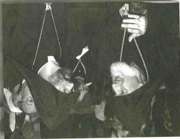
其他派代表出席大慶