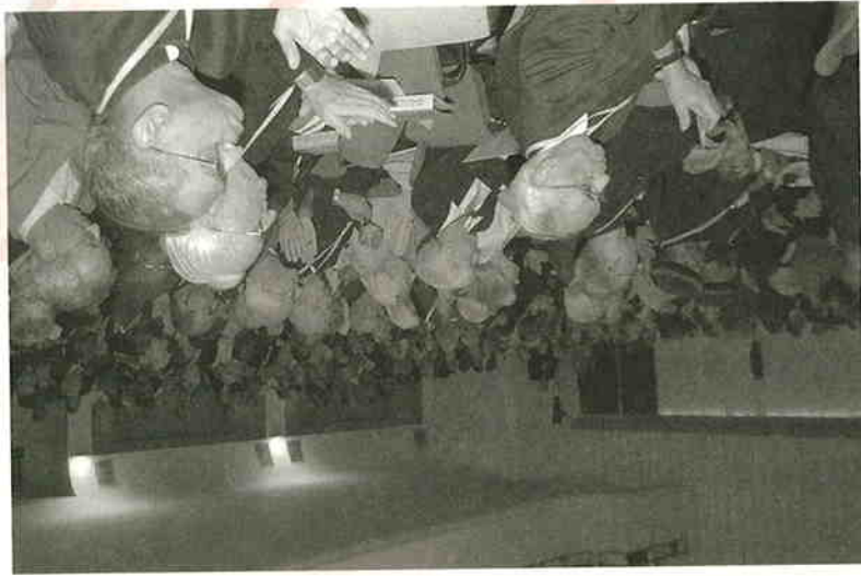
聖經大會匯聚了四百五十五位多參加者

為紀念及慶祝《天主的啟示教義憲章》頒布四十周年，天主教世界聖經協會與宗座促進基督徒合一委員會聯合主辦國際聖經大會，主題為「聖經在教會的生活中」。大會於9月14至18日假意大利羅馬舉行，匯集了來自一百個國家逾四百五十名參加者，當中包括六十多位主教及其他教派代表。