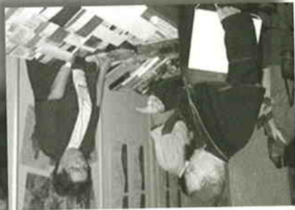
於比聖繪畫展覽覽