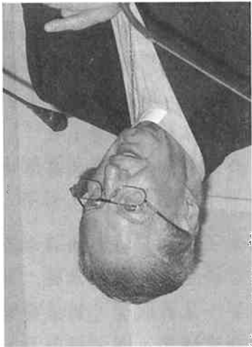
意大利米蘭總主教馬丁尼樞機

馬丁尼樞機概述個人體會《啟示憲章》及聖經在教會生活中的發展過程，同時亦對「聖言誦讀」(或稱「神聖閱讀法」，包含閱讀、默想、靜思及回應等步驟)