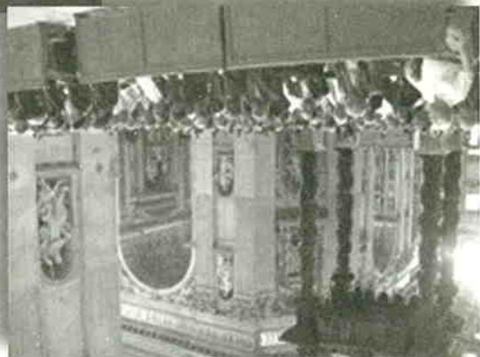
全體在聖伯多祿大殿舉行感恩祭