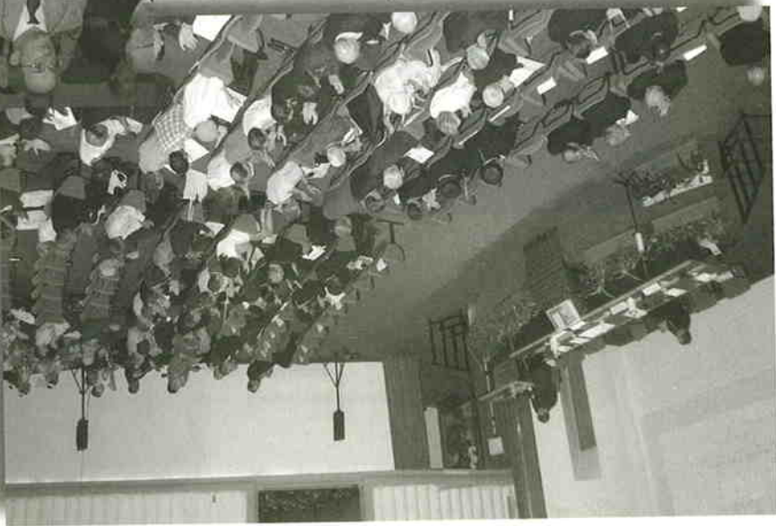
大會雲集世界各地參加者 促進交流