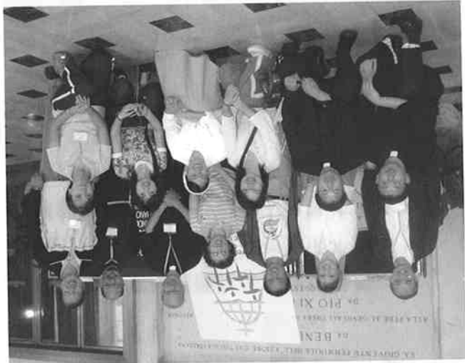
香港、澳門及中國的代表

作為國際聖經大會的總結及前瞻，世協四大區域亦就實踐《啟示憲章》作出回顧及策劃未來聖言工作的方向。世界聖經協會將來的主教會議能採用「天主聖言在教會中的生活和使命」為主題，並願意為這項目作出貢獻。